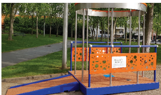
Une structure entièrement accessible aux PMR*

Grâce à ses buses d'atomisation, Kiosque ILO'O® offre une brumisation économe et rafraîchissante