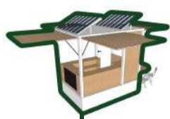
Kiosque M 3/4 pers