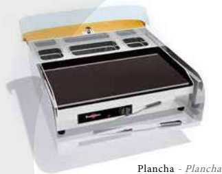
Plancha - Plancha