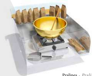
Pralines - Pralines