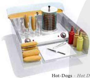
Hot-Dogs - Hot Dogs