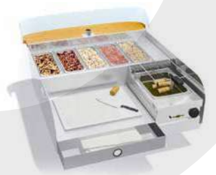
Nems - Fried Spring Rolls