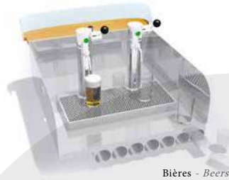
Bières - Beers