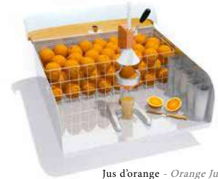
Jus d'orange - Orange Juice