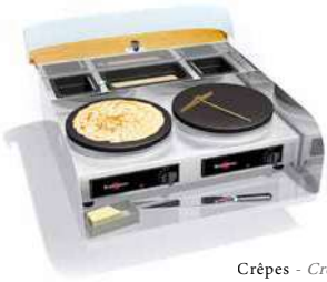
Crêpes - Crepe