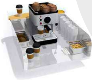
Café - Coffee