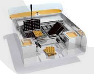
Gaufres - Waffles