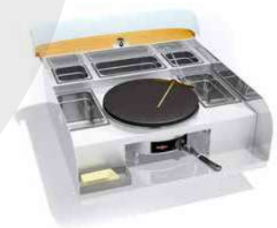
Crêpe - 1 Crepe USA

... et plein d'autres possibilités, en fonction des demandes, du moment que ça rentre sur le plan de travail en inox !