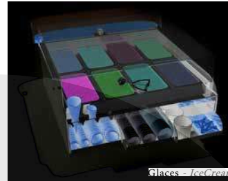
Glaces - IceCream