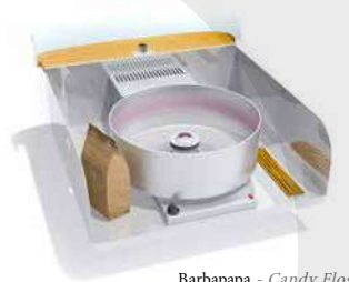
Barbapapa - Candy Floss (Cotton Candy)